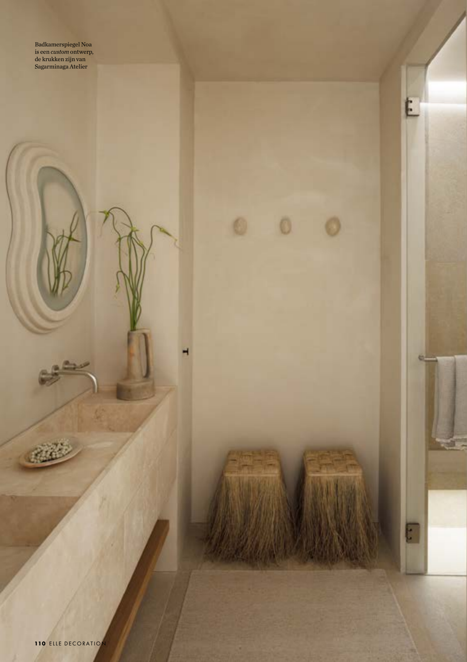
Badkamerspiegel Noa is een custom ontwerp, de krukken zijn van Sagarminaga Atelier