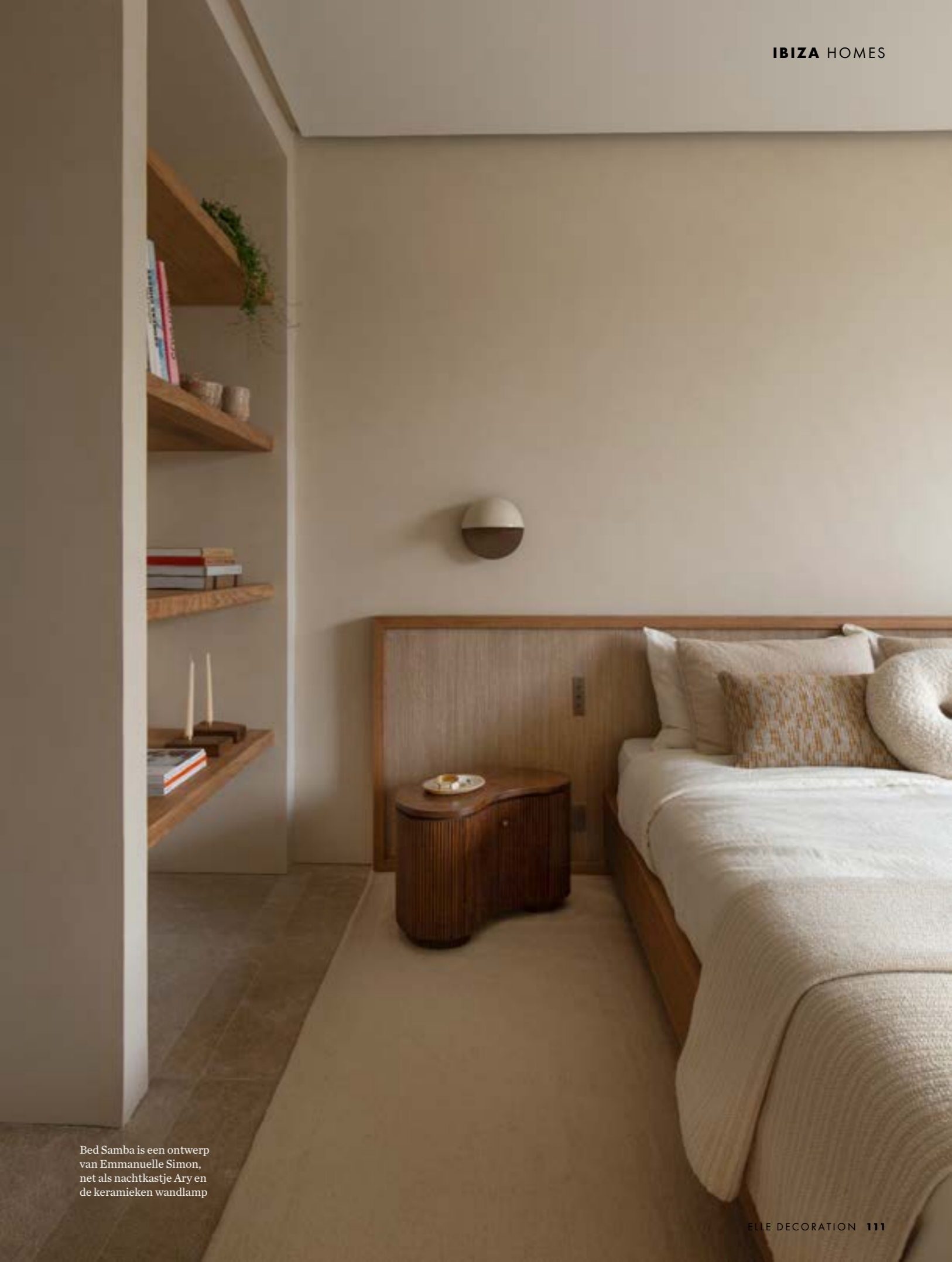
Bed Samba is een ontwerp van Emmanuelle Simon, net als nachtkastje Ary en de keramieken wandlamp