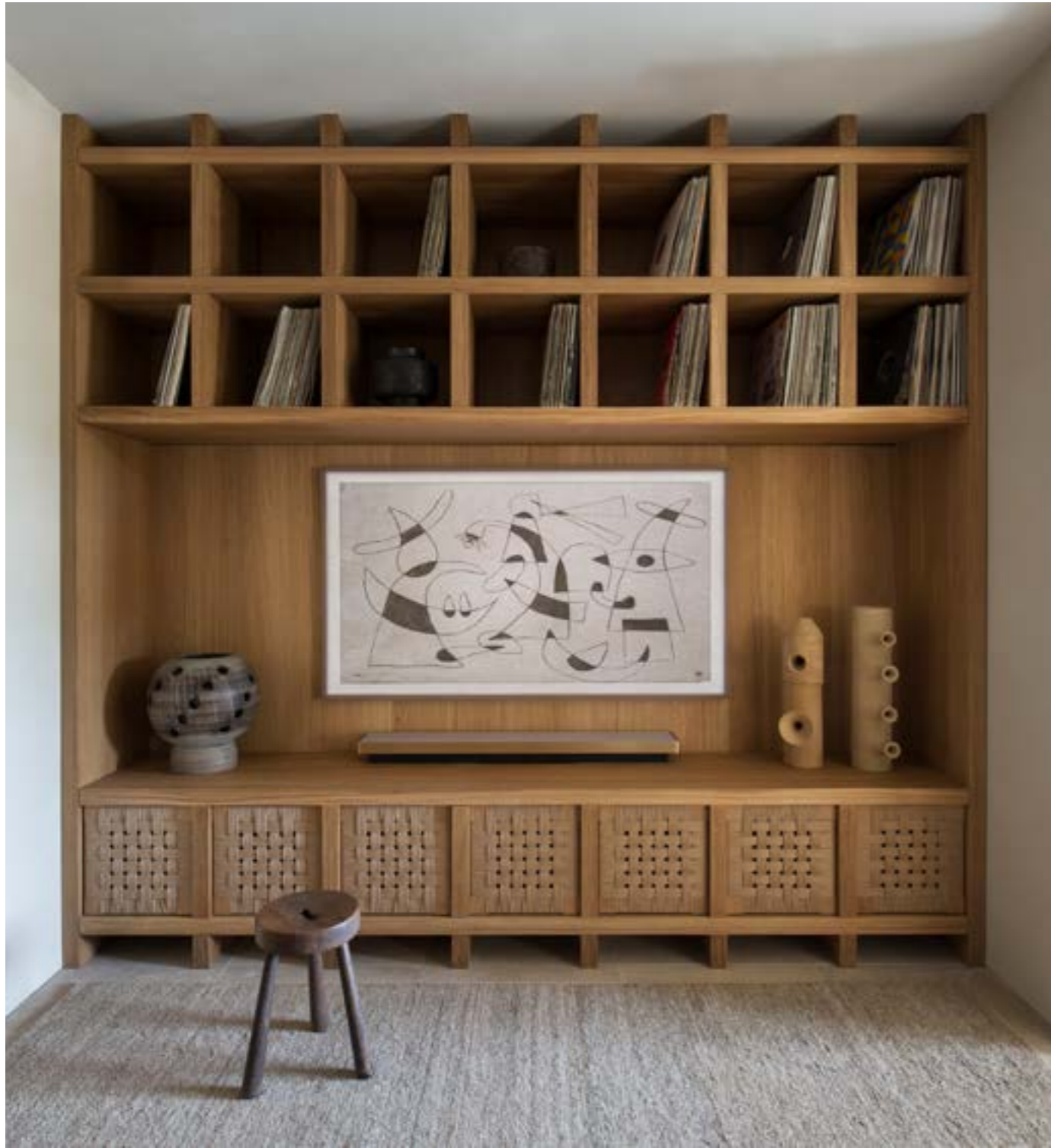
De wandkast met geweven details is maatwerk. Erin hangt waterverfschilderij Conversation sur le jardin van Hermentaire. De keramieken totems rechts zijn van Tado; de keramieken lamp links komt van een vlooiemarkt in het Franse Saint-Ouen. Het houten krukje is een vintagestuk van de op Ibiza gevestigde Galeria Tambien

'KUNST FUNGEERT ALS ANKER IN MIJN PROJECTEN: HET IS NOOIT SLECHTS DECORATIEF'